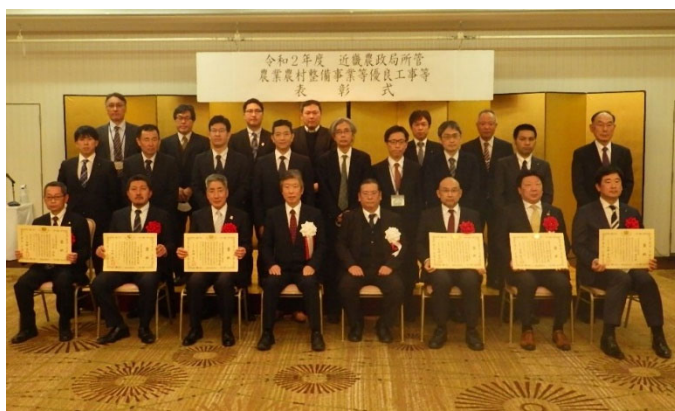
授与式後の記念撮影