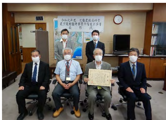
授与式後の記念撮影