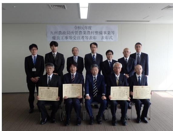
授与式後の記念撮影