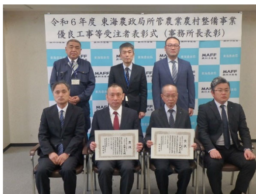
授与式後の記念撮影