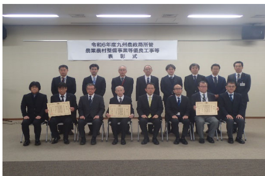
授与式後の記念撮影