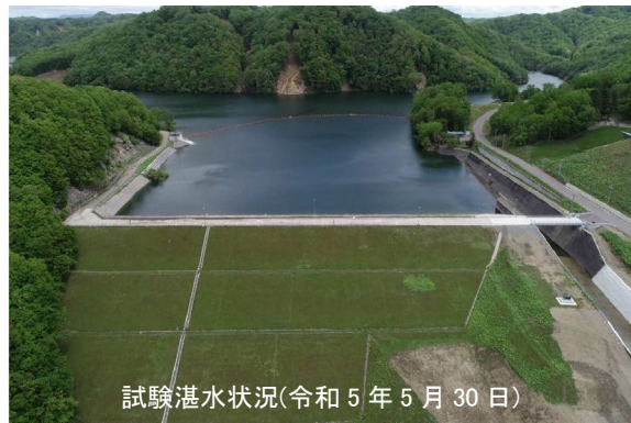
試験湛水状況(令和5年5月30日)

厚真ダムの状況