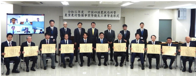
授与式後の記念撮影