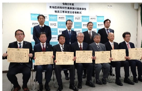
授与式後の記念撮影