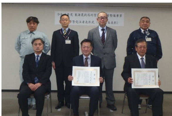
授与式後の記念撮影