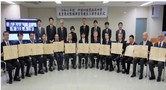
授与式後の記念撮影