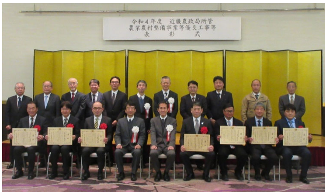
授与式後の記念撮影