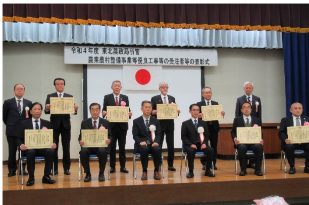
授与式後の記念撮影