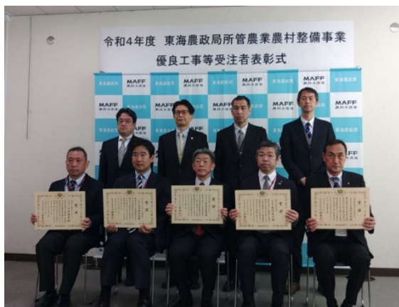
授与式後の記念撮影