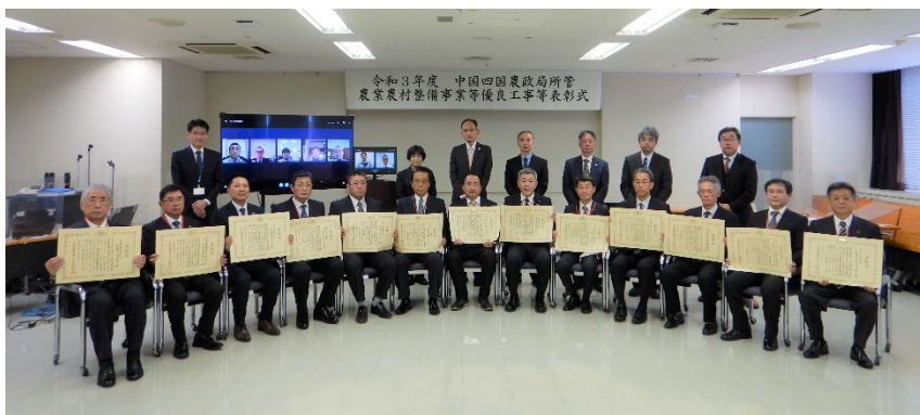
授与式後の記念撮影